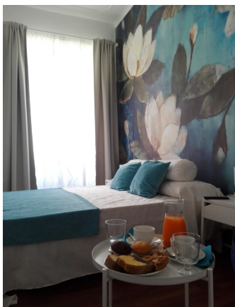
Magnolia doppia standard