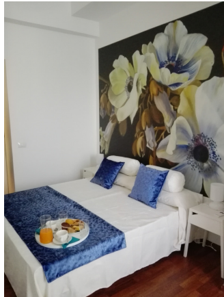
Camelia doppia + 1 letto agg.