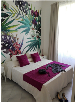
Orchidea doppia standard