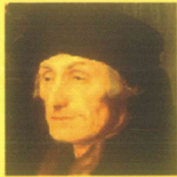
CAMERA PENALE DI MESSINA "Erasmus da Rotterdam"