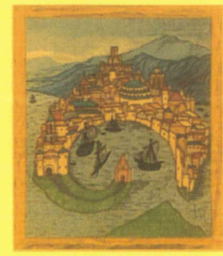
Con il Patrocinio ORDINE AVVOCATI DI MESSINA

La Camera Penale di Messina "Erasmus da Rotterdam" con il Movimento per le Pari Opportunità di Messina e con il Patrocinio dell'Ordine degli Avvocati di Messina, in occasione della Giornata Internazionale della Donna del 8.3.2022 organizza un incontro, nell'Aula Magna della Corte di Appello di Messina, sul